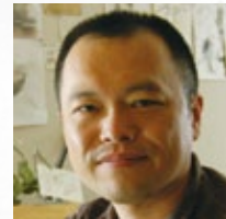
山村 浩二 (やまむら こうじ)

アニメーションと音楽。フレーム毎に紡ぎだされるイマジネーション豊かな映像の世界と、感情を表現し、心を揺り動かす音楽の世界。その深い関係性について語ります。(講師：山村 浩二)