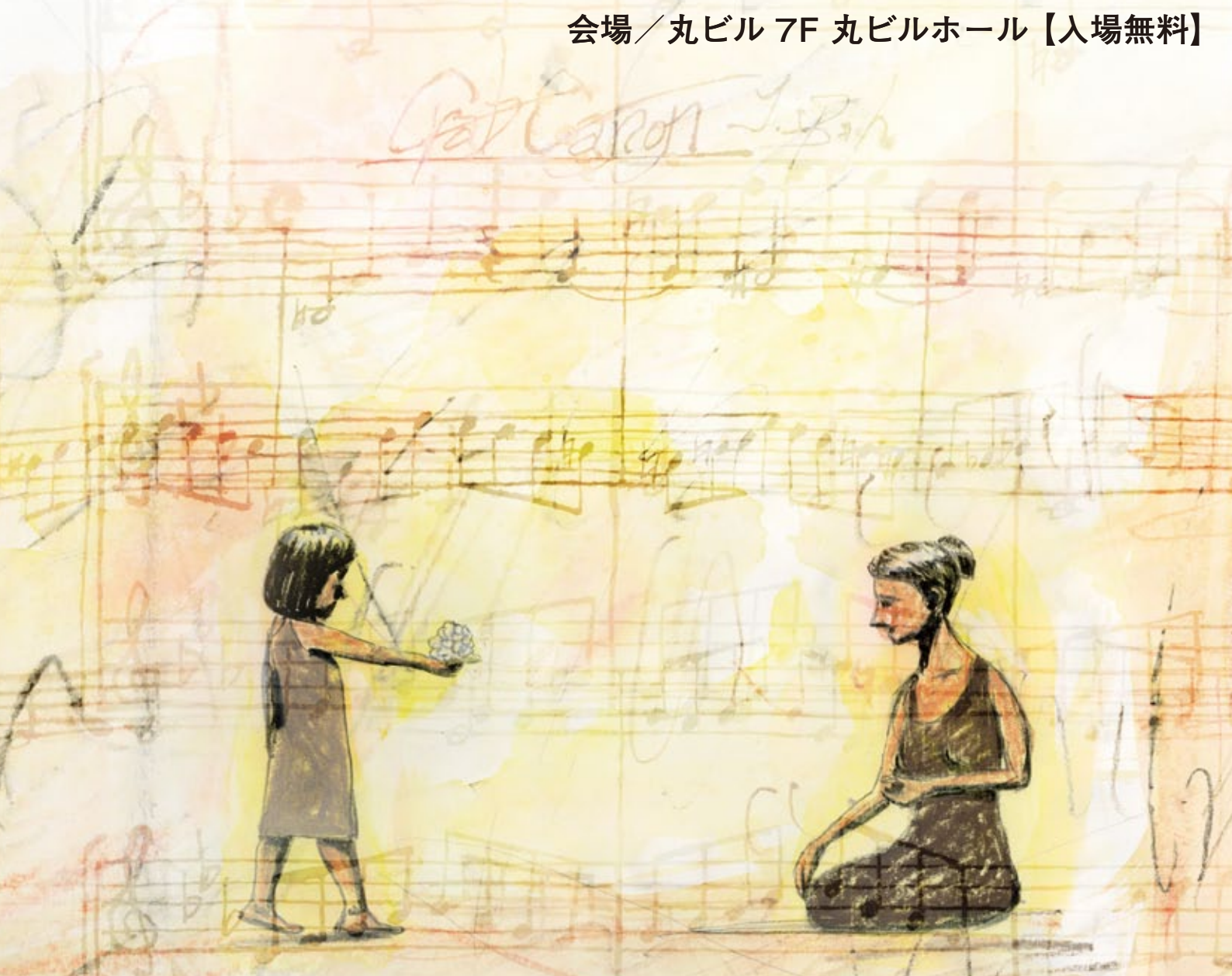
Illustration by Koji Yamamura