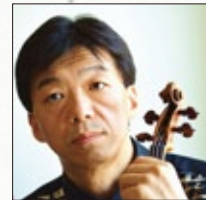
松原 勝也 (まつばら かつや)

東京藝術大学卒。クライスラー国際コンクールなどで上位入賞。新日本フィルハーモニー交響楽団コンサートマスターを歴任。第17回中島健蔵音楽賞、第55回文化庁芸術祭新人賞受賞。東京藝術大学音楽学部教授。