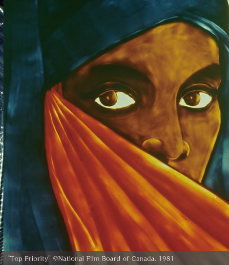
"Top Priority" ©National Film Board of Canada, 1981