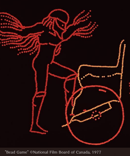
"Bead Game" ©National Film Board of Canada, 1977