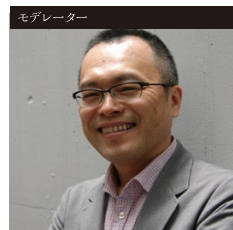
山村 浩二 (本学アニメーション専攻教授)

(アニメーション監督) カナダ国立映画制作庁(NFB)にて、25年間に渡り数々の優れた短編アニメーション作品を制作。また、NHKやイギリスのチャンネル4との共同制作も行っている。英国アカデミー賞(BAFTA)やアカデミー賞短編アニメーション賞への2回のノミネート、ベルリン国際映画祭の銀熊賞、アヌシー国際アニメーション映画祭のグランプリやモントリオール世界映画祭のグランプリなど世界中で数多くの受賞。南カリフォルニア大学映画芸術学部及び、南洋理工大学での教員。南洋理工大学内に実験的アニメーションに向けた立体(コマ撮り)アニメーション施設を設立。米国アカデミー賞(映画芸術科学アカデミー)会員。